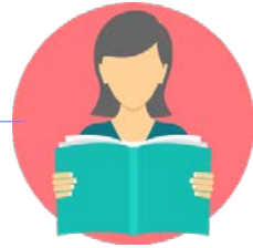
교양 수업 이수