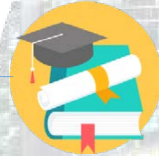
교양 학점 부여