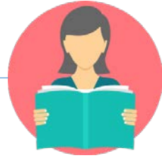
전공 수업 이수