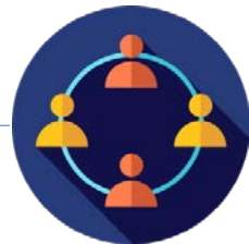
비교과 프로그램 이수